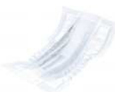
大王製紙 長時間安心パッド ダブルブロック