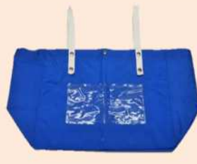
入院セット用バッグ