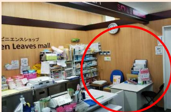
お渡し場所（1階院内売店）