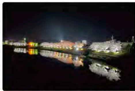
第1位 りんごみかん

令和2年から開催していますインスタ大会も今年で3回目になりました。この大会は、職員から募集した益田に関連する写真や動画の投稿をする大会です。8月30日～2月15日までの期間中の投稿に対して、皆さんからの「いいね」の数で順位を決定しました。グランプリから3位までの結果をお知らせします！