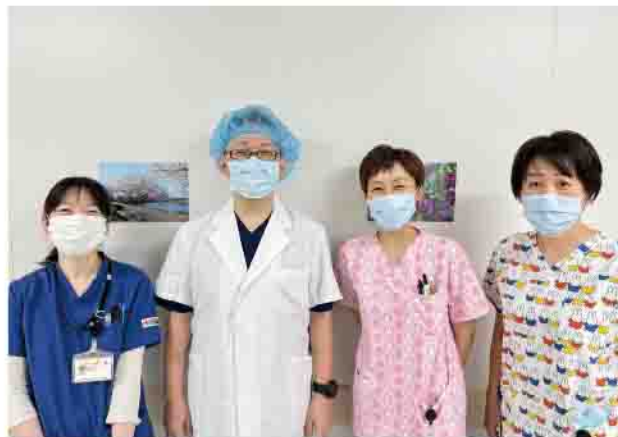
術後疼痛管理チーム