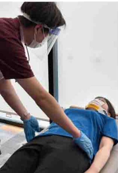
黄エリア：中等症患者を治療