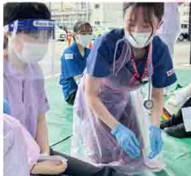
緑エリア：軽傷患者を診察