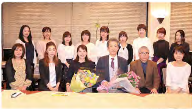
20周年記念の会職員一同

高齢化社会を迎え、「ロコモ」という概念が広がっております。運動器の障害により介助が必要となったり、そうなる危険性が高い状態を表します。「立つ」「歩く」といった運動器の健康は社会生活を支える基盤と考えます。これからも地域の皆様の運動器の健康の維持にお手伝いできますよう、「患者さんに寄り添う医療」をモットーに頑張ろうと思えます。