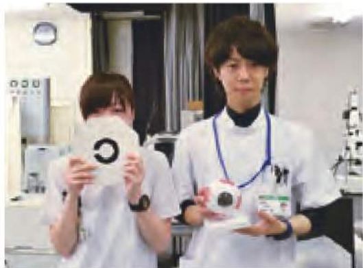
▲OCT(眼底三次元画像解析)検査で網膜をチェックしています。

査を行っています。視力、屈折、眼圧、視野、調節、色覚、光覚、眼位、眼球運動、瞳孔、涙液などの検査の他に、超音波、電気生理学、眼底写真撮影などがあります。