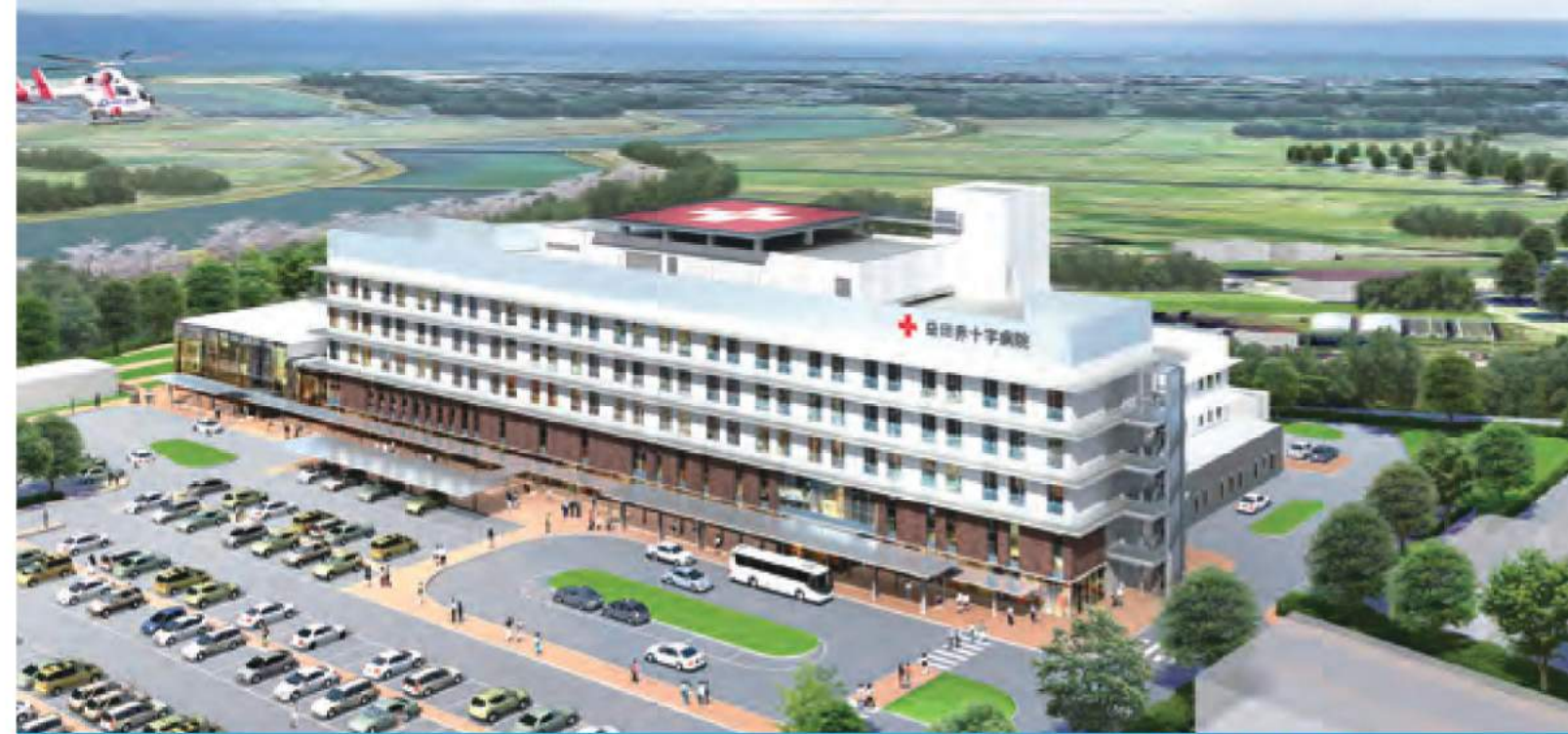
※駐車場整備は平成28年10月完了予定です。

【参加施設】済生会江津総合病院／国立病院機構浜田医療センター／医療法人正光会松ヶ丘病院／松江医療センター／済生会広島病院 済生会呉病院／医療法人社団慈生会 萩慈生病院／益田赤十字病院