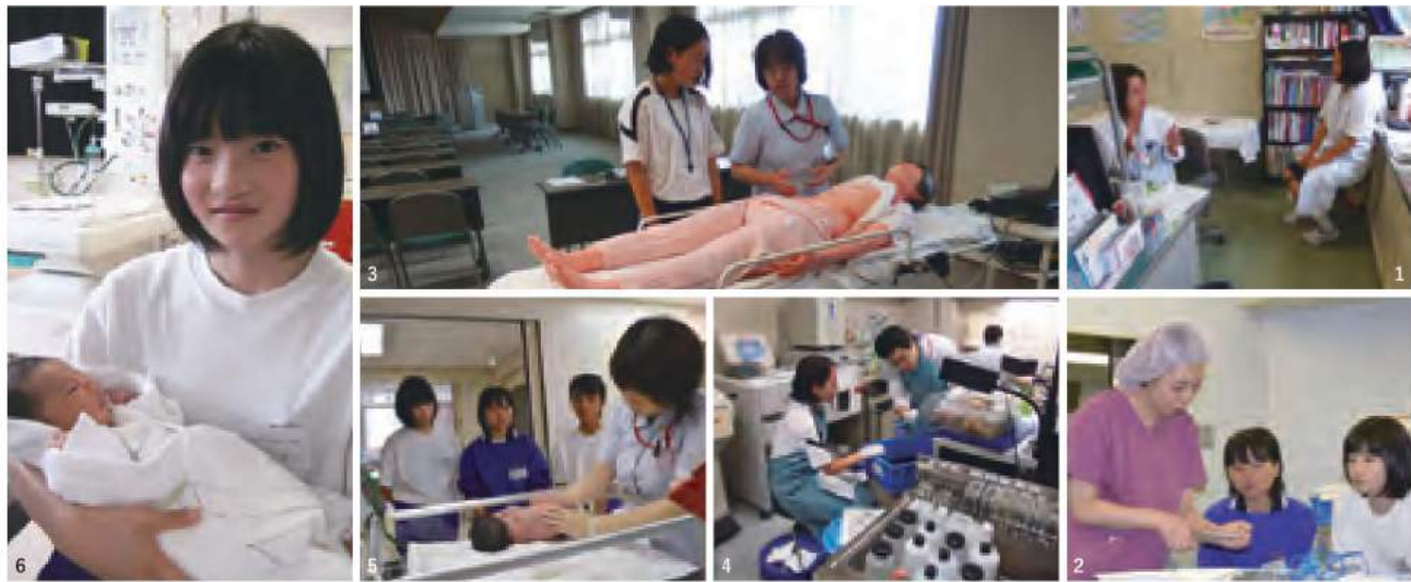
1.外来見学：小児科で診察を見学、医師の話听取了。 2.手術室：持針器に針をつけて糸で縫いました。 3.シュミレーターを使い聴診器で呼吸の音を聞きました。 4.検査室：病理検査室を見学。本物の組織を見ました。 5.新生児室：生まれたばかりの赤ちゃんを観察。 6.新生児室：赤ちゃんを抱っこ、かわいいです。 7・8・9・10.手術室：清潔に手洗いし、手術着を着ました。ガウン・ネックは難しい。手術着は着ると暑かったです。 11.栄養士さんと病院食を「いただきます。」

医師、看護師の体験に東陽中学校3名、鎌手中学校1名の生徒が来てくれました。 新生児室では生まれたばかりの赤ちゃんのケアを体験、沐浴も手伝いました。手術室では清潔について学び、手洗いの後、手術着を着ました。聴診器の使い方も体験しました。病院という現場で職員の生の話を真剣に聞いていました。2日間を通して、普段は見ることのできない病院の裏側を見学・体験しました。医師、看護師についての理解を深め、ひとりでも多くの生徒に医療職を目指してもらいたいと思います。 実習終了後には「生まれたばかりの赤ちゃんを見て感動しました。」「看護師さんはとても大変だけど、とてもやりがいのある仕事だと思いました。」「初めて知ったことがたくさんありました。夢に向かって勉強頑張ります。」と感想をいただきました。 短い時間でしたが、今回の経験が中学生の皆さんにとって将来の進路選択の一助になれば幸いです。