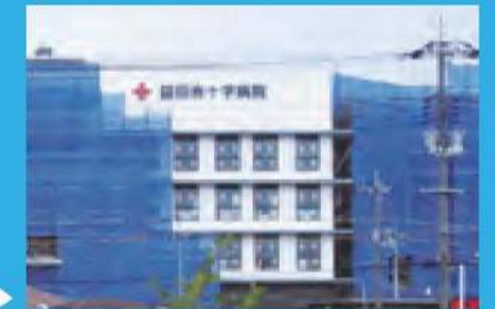
国道側から、新病院の外観の一部を見ることができます。▶

現在は、躯体工事が完了し、急ピッチで内装・電気・衛生工事を進めています。竣工後、約2カ月の準備期間を経て、平成28年1月に開院する予定です。