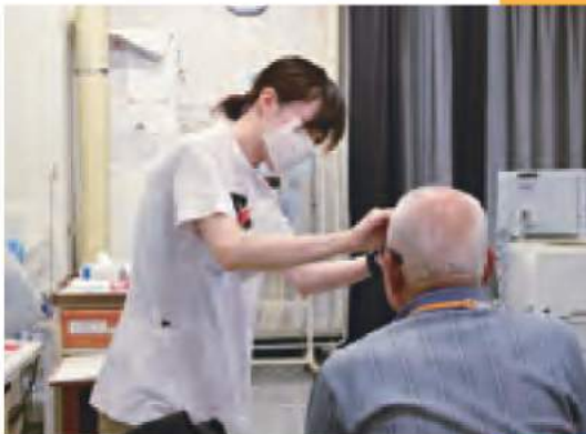
▲視力検査を行います。

眼科の検査というと、学校で受けた「視力検査」が想像されると思いますが、視能訓練士はさらに複雑で様々な検査器具を用いて精密検