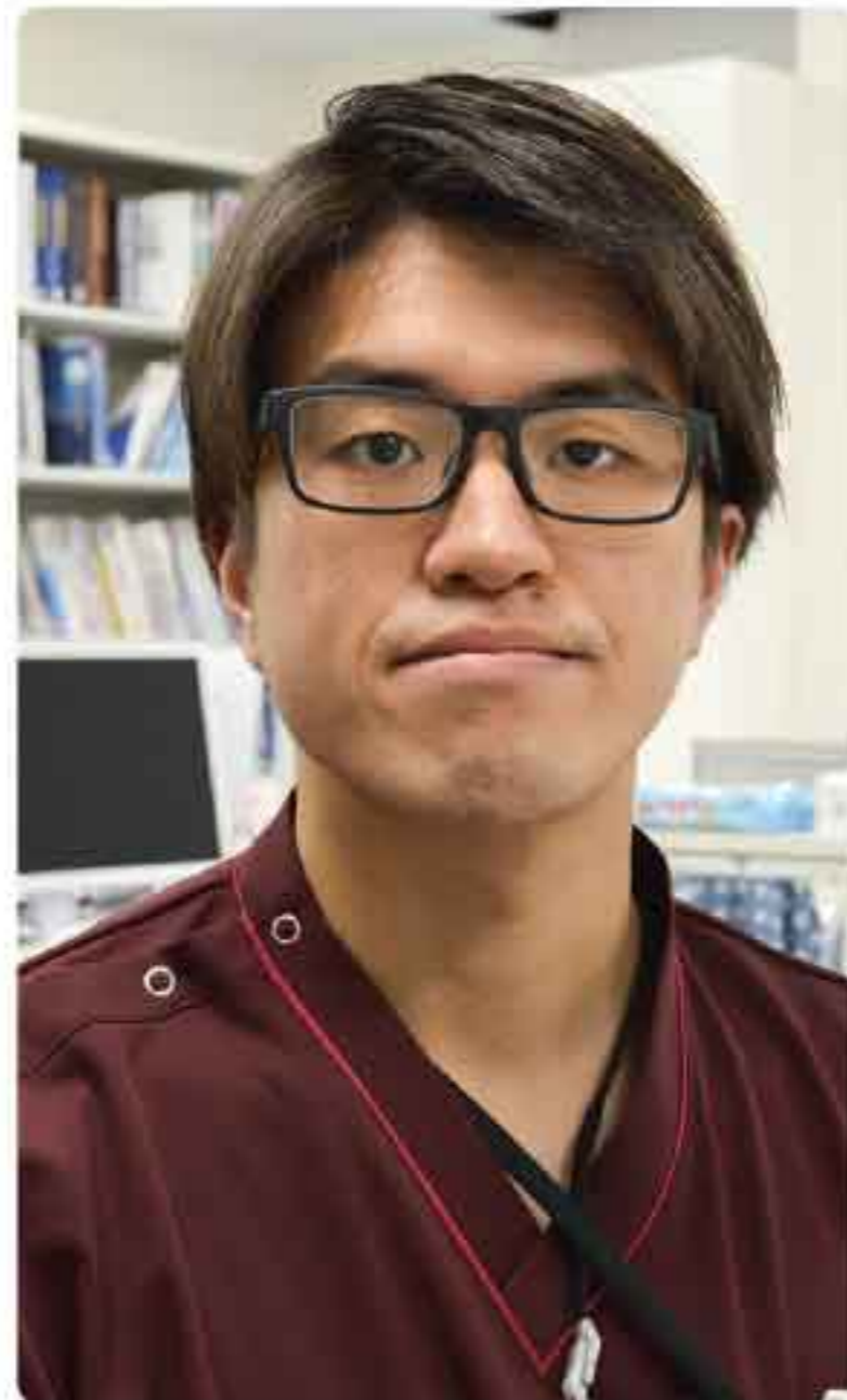
● 出身：松江市 ● 趣味：水泳、サウナ

昔は太っていて太りやすいことから基本的にいつもダイエットをしています。この飢えを力に変えて、ハングリースピリットで、食べ物ではなく、知識やスキルをガツガツ取り込みます！