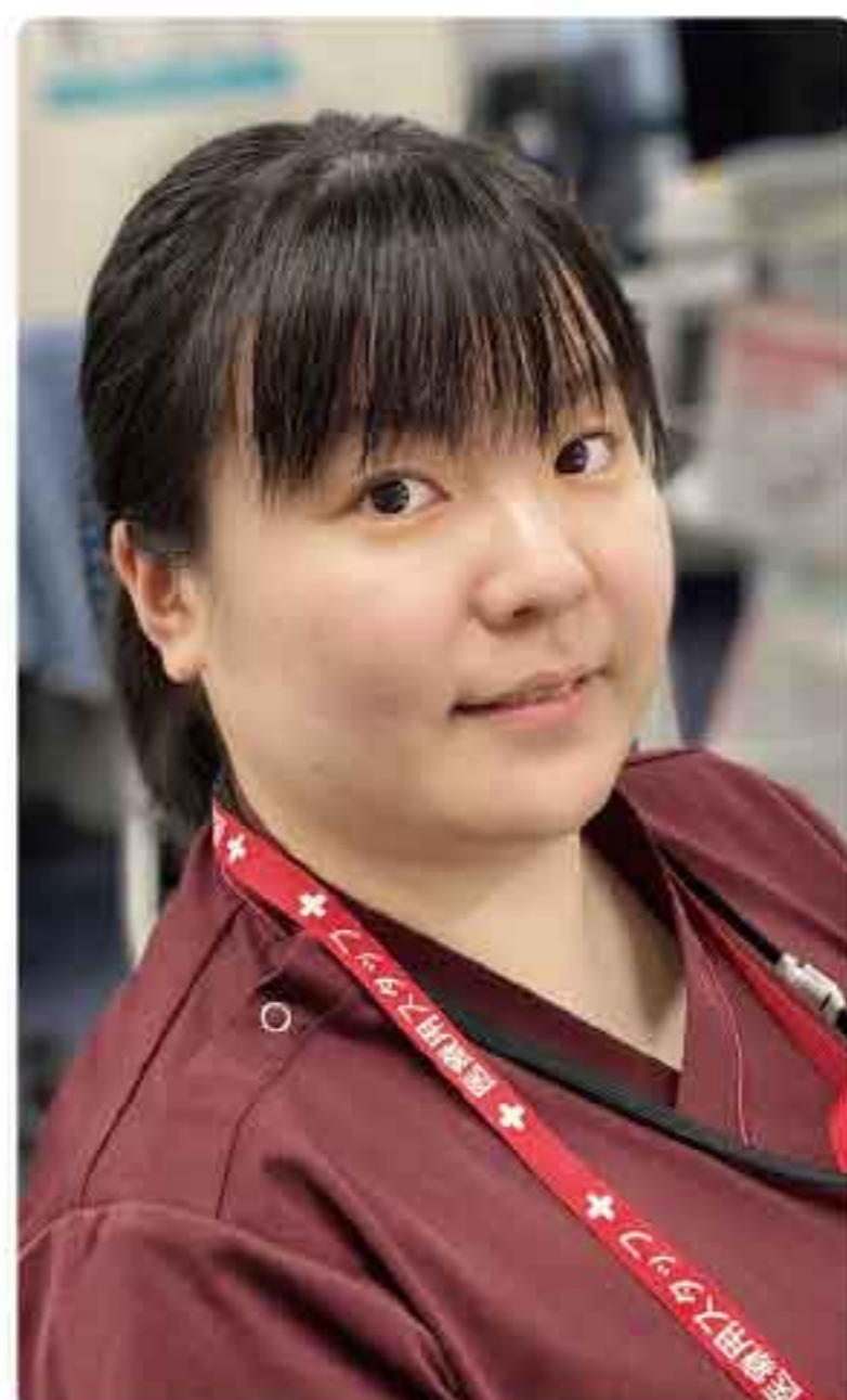
● 出身：岡山市 ● 趣味：読書

医師として、社会人としての姿勢を2年間しっかり学びたいと思っています。地域の皆様の力になれるよう日々精進します。よろしくお願いいたします。