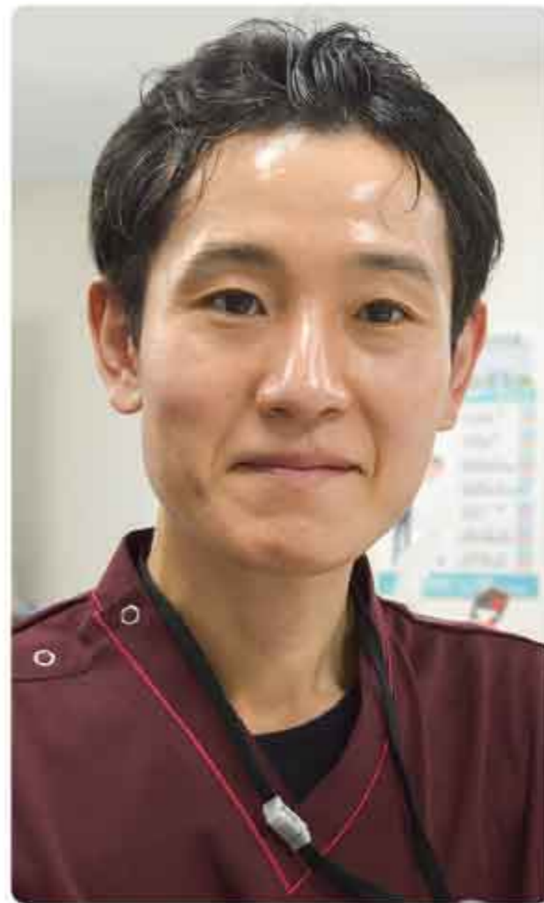
● 出身：東京都 ● 趣味：ランニング、仮装、大食いチャレンジ

私は研修医として益田赤十字病院で勤務させていただくのは1年ですが、2年目以降に繋がられるよう充実した1年にしたいと思えます。よろしくお願いたします。