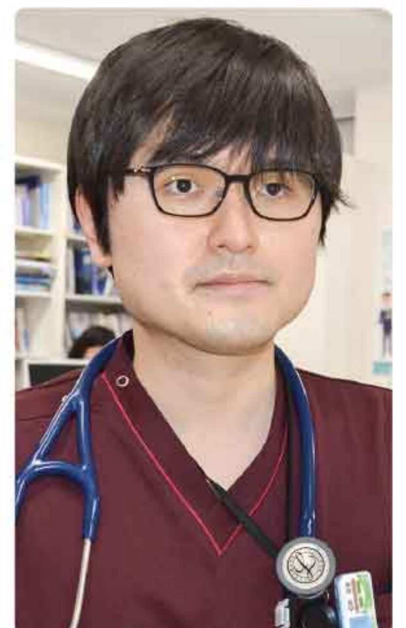
● 出身：横浜市 ● 趣味：ウォーキング

研修の機会をいただきましたことを大変ありがたく感じております。社会人としての自覚を持ち、一人前の医師となるべく日々努力を重ねて行きたいと思っております。よろしくお願いいたします。