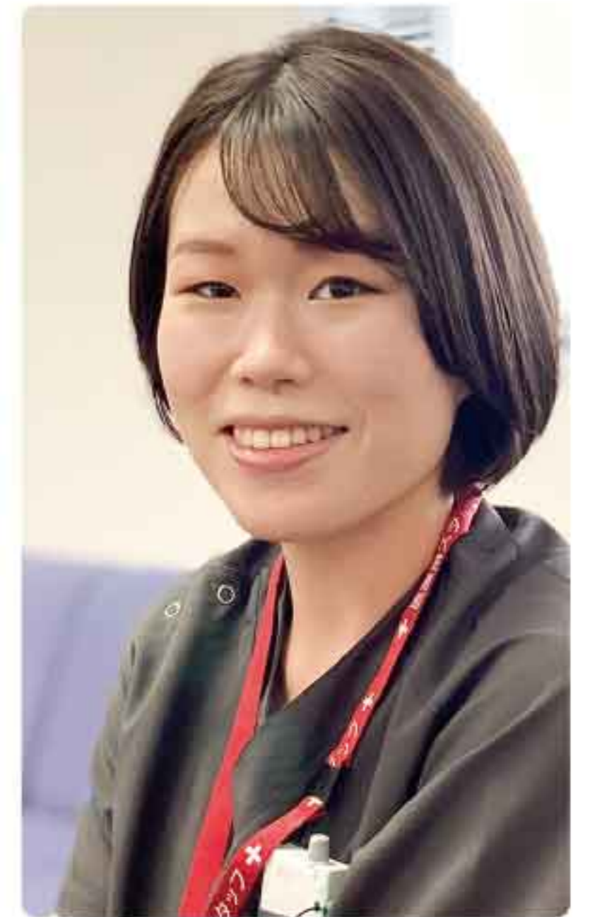
● 出身：隠岐の島 ● 趣味：料理、散歩

医療を実地で研修している医師を「研修医」といいます。大学病院または臨床研修指定病院において、初期臨床研修を2年間行います。