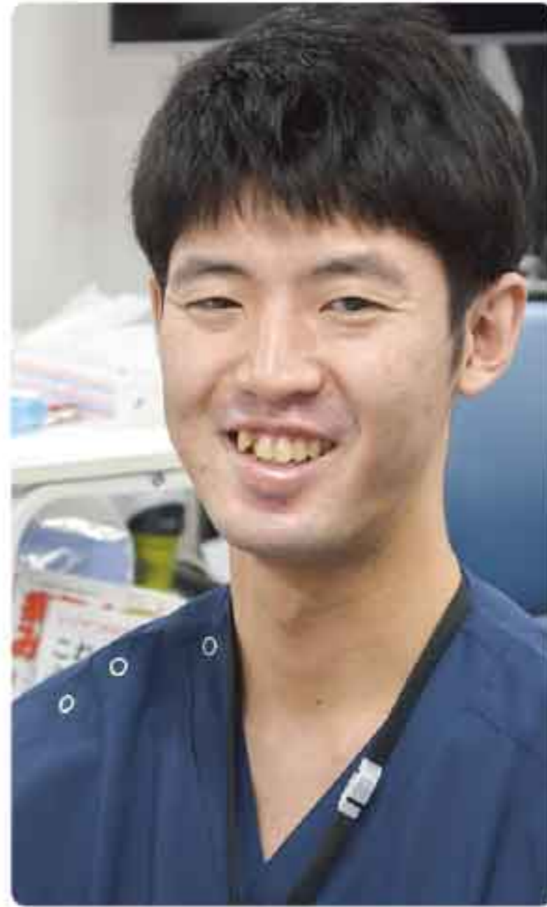
● 出身：飯南町 ● 趣味：テニス、ドライブ

益田市の医療に貢献できるよう、一生懸命頑張ります！未熟ではありますが、ご指導ご鞭撻のほどよろしくお願いいたします。